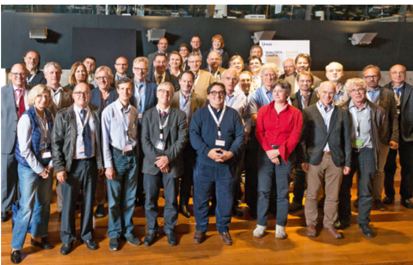
Feierlicher Akt an der Ärztekammer vom 27. Oktober 2016: Vertreterinnen und Vertreter der unterzeichnenden Ärzteorganisationen der Qualitäts-Charta SAQM (Quelle: Frederike Asael).