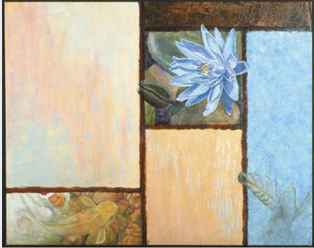
Ghost Fish by Carole R. Moore

Donnerstag, 23. Februar 2012, 14.00–16.45 Uhr Hörsaal Monakow, UniversitätsSpital Zürich