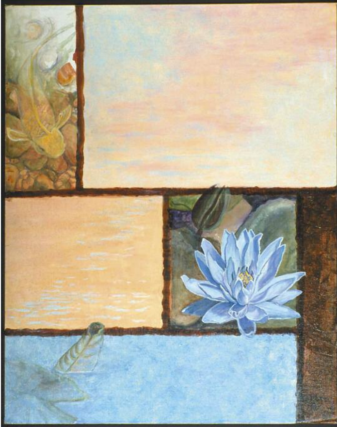
Ghost Fish by Carole R. Moore

Donnerstag, 23. Februar 2012, 14.00–16.45 Uhr Hörsaal Monakow, UniversitätsSpital Zürich